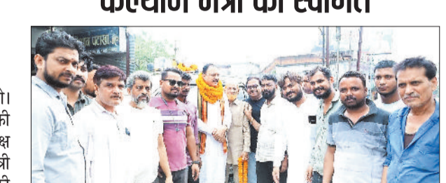
स्वागत करते समाज के लोग।