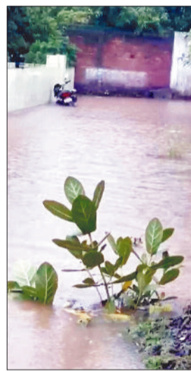
शहर में जलमग्न हुई नपा के पीछे की कालोनी।

खिल गए। वर्तमान में धान की पानी की कमी होती जा रही थी, बारिश खेतों में पानी की कमी को फसलों में कई क्षेत्रों के खेतों में ऐसे समय में हुई मूसलाधार पूरा कर दिया।