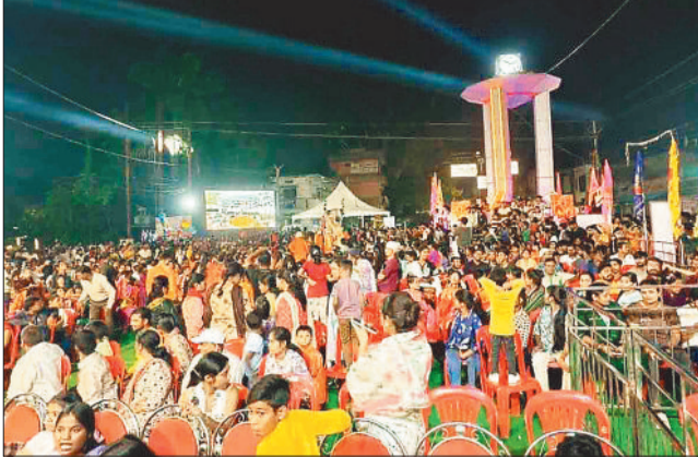
कार्यक्रम में उपस्थित नगरवासी।