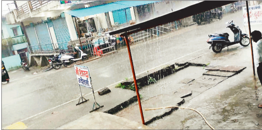
उबरीपारा में जाम नाली।

उल्लेखनीय है कि अब बारिश विदाई की ओर है और ऐसे समय में आश्विन माह के पहले दिन घंटेभर से ज्यादा देर की बारिश से शहर को तर बतार कर दिया, इसी तरह का हाल जिले के कई ग्रामीण क्षेत्रों की भी रही। इस दिन तेज गर्जना के साथ झमाझम बारिश से किसानों के चेहरे भी