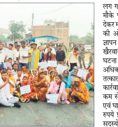
मुआवजे की मांग को लेकर प्रदर्शन करते ग्रामीण।