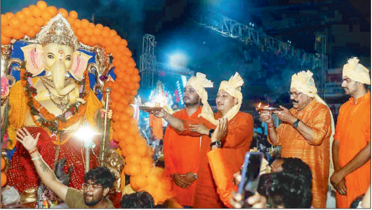
विसर्जन के दौरान गणेश प्रतिमा की आरती करते समिति के सदस्य।