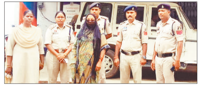
पुलिस गिरफ्त में आरोपी महिला।

सोमवार को हो रही बारिश के दौरान जिला मुख्यालय के निकट खाड़ी मुख्य मार्ग पर अचानक एक पेड़ का डंठल टूट कर गिर गया। इस दौरान किसी के आवागमन नहीं करने के कारण किसी तरह की कोई दुर्घटना होने से बच गई। मुख्य मार्ग पर पेड़ गिरने से कुछ देर के लिए यातायात बाधित हुआ। सड़क पर गिरे पेड़ को हटाया गया, इसके बाद यातायात सामान्य हुई।